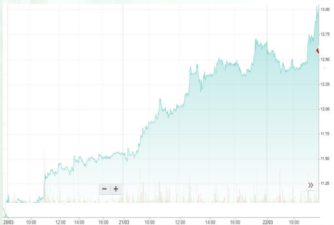
Preissteigerung vom 20.03. 08.00h von 11,00 Euro/t bis zum 22.03.2018 um 11.32h bei 13,04 Euro/t

Dies alles führt zu einer Dynamik, die wiederum Investoren und Zocker anzieht, die laut Aussage von Brokern teilweise Optionen kaufen, die auf Preise bis zu 50 Euro pro EUA wetten.